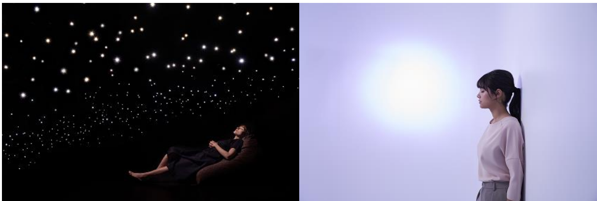
明暗が対照的な2つの部屋を行き来することで五感を解放する「Immersive Meditation」

ザ ロイヤルパークホテル アイコニック 東京汐留(所在地:東京都港区東新橋 1-6-3、総支配人:柘植 裕次)と、没入体験型メディテーションスタジオを運営する Medicha (メディーチャ) 株式会社(本社:東京都千代田区)は、同社が運営する「Medicha」でのメディテーション(瞑想 ※ )を体験できる初のコラボ宿泊プランを 2020年10月1日(木)から販売いたします。