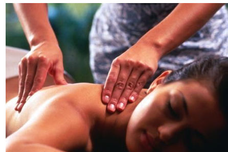
人気のトリートメント「バリニーズ」、または日本限定「サマルパン」からお選びいただけます。