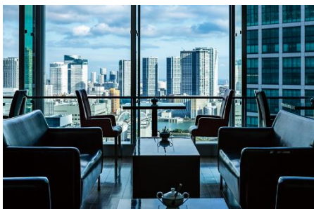
THE BARにてウェルカムドリンクでお出迎え。(チェックインもこちらで行います。)