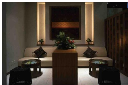
日本で唯一の「マンダラ・スパ」でのトリートメント付(写真はカウンセリングスペース)