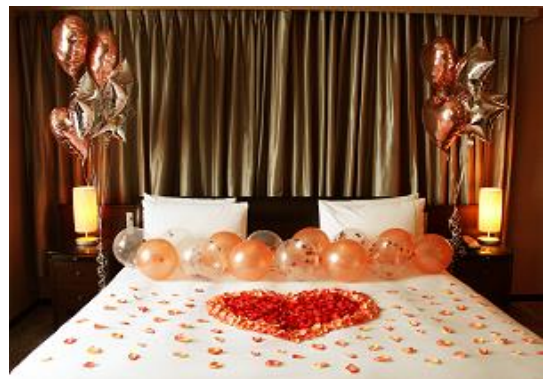
ジュニアスイート(キング) ※画像はイメージです。

プランには、お部屋代、シャンパン(ハーフボトル)、ご朝食が含まれます。 ※ベッドデコレーションを行います。 ご到着のお時間をご連絡いただきますようお願いいたします。