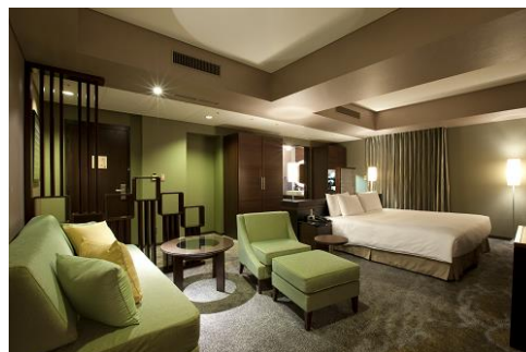
ジュニアスイート(キング)