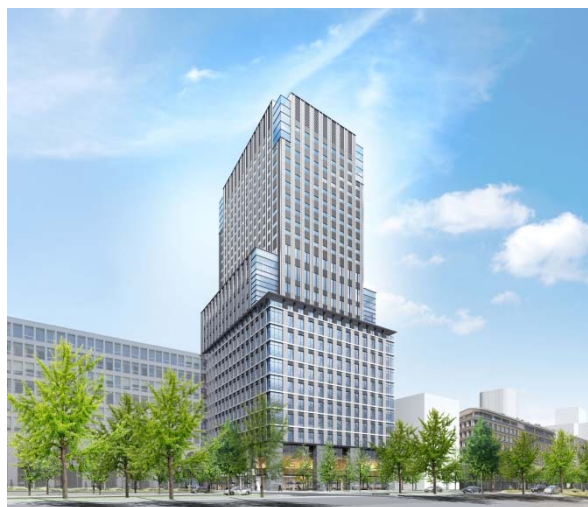
ザ ロイヤルパークホテル アイコニック 大阪御堂筋 外観パース(イメージ)