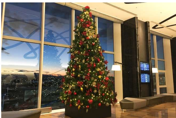
クリスマスツリー（画像は2019年ロビー展示時のものです）