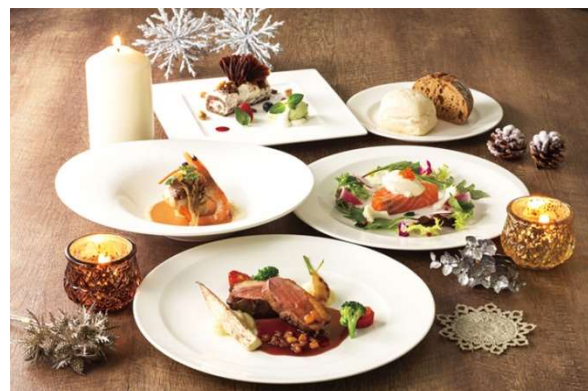
見た目も鮮やかなコースメニュー