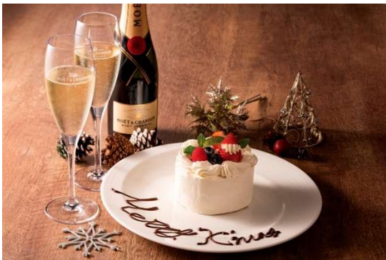
ケーキとシャンパンはご希望の時間にお届け

◇シャンパン（Moët & Chandon Brut Impérial）ハーフボトル1本とクリスマスケーキ（ホール直径約10cm）をお部屋へお届け。【お届け可能時間 17:30～22:00】