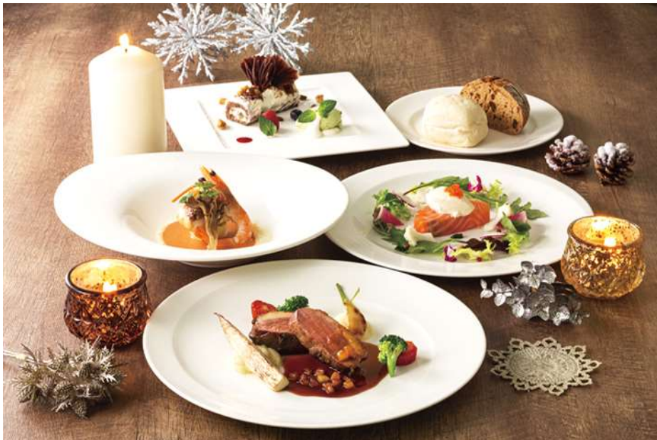
開放的な空間で味わうクリスマスディナーコース

*プラス1,200円(消費税込)にて、メインの肉料理を鴨から牛フィレ肉にご変更いただけます。