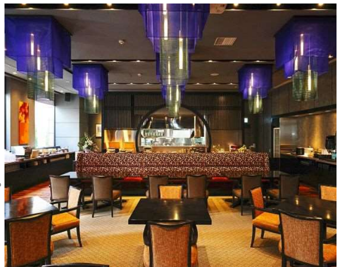
「Precious ONO HAKATA」店内

おすすめは身体をポカポカに温め、 エネルギー源にもなる「中華粥」と「餡掛け卵料理」。 メには、さっぱりとした「朝からめる麺料理」の“メラー”。 ブッフェ台にずらりと並んだ約50種類のお料理で、 ゆっくりとお過ごしください。