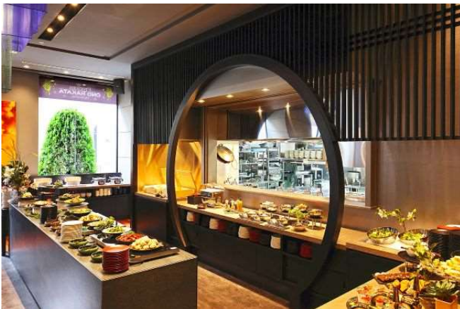
三井ガーデンホテル福岡中洲 「小野の離れ 博多本店」朝食