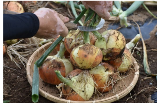
▲ヒシを使った堆肥で栽培された玉ねぎ