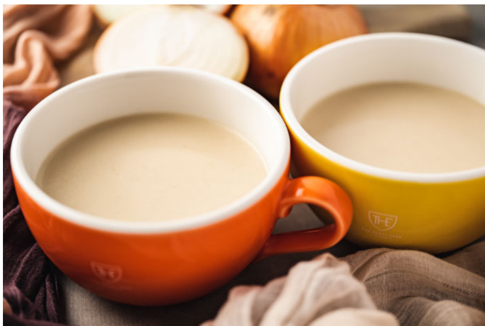
▲スープの提供イメージ

また、ロイヤルパークホテルズアンドリゾーツでは昨年8月より期間限定で、ヒシを含む堆肥で栽培された玉ねぎを使用し、グループ統括総料理長監修のもとスープに加工したものを、ロイヤルパークホテルズの一部にて提供いたしました。昨年に引き続き、本年は対象ホテルを増やして9月1日より期間限定でこの玉ねぎを使用したメニューをお客様へご提供。さらに、玉ねぎと同じくヒシを含む堆肥で栽培されたニンニクを、一部ホテルの鉄板焼レストランにてガーリックライス等として提供いたします。