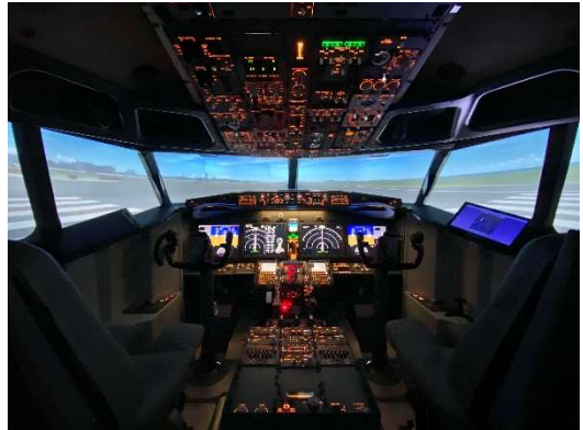
フライトシミュレーターイメージ[B737]

*1:「LUXURY FLIGHT 羽田空港本店」は羽田空港第1ターミナル5階「THE HANEDA HOUSE」内にごございます。