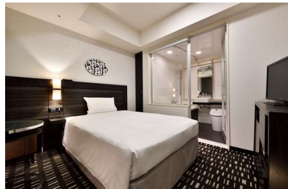
客室の一例(コンフォートシングル)