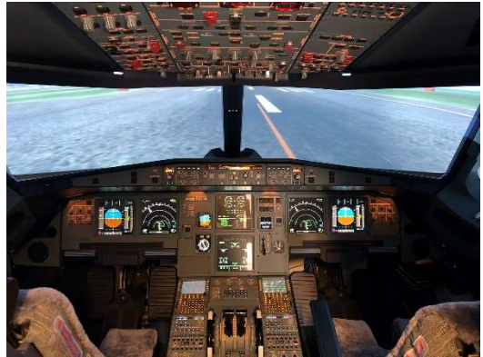
フライトシミュレーターイメージ[A320]