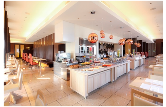
レストラン「ハーモニー」内観

チョコレートを食べ比べてお気に入りのチョコレートをひとつ選び、ハッシュタグをつけてSNSにアップした画面をレストランスタッフに提示すると、その場で明治ザ・チョコレートをお一人様1箱プレゼントいたします。