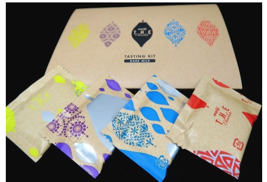
ブリリアントミルク、サニーミルク、ビビッドミルク、ベルベットミルクの4種類をテイスティングできるキット。