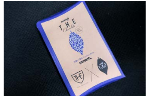
チョコレートを包むケースは、ロイヤルパークホテル ザ シリーズで実施中のバレンタイン企画のみの限定デザインです。