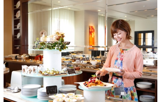
楽しい会話や時間、普段と違ったランチを楽しむならオクタカフェへどうぞお越しください。

月替わりのメインや手作りのデザートなどがお楽しみいただける「オクタカフェ」で、期間中にランチbuffetをご利用いただいた方各日先着10名様に、ギフトパッケージにはいった「明治ザ・チョコレート コンフォートビター」(50g)をプレゼントいたします。