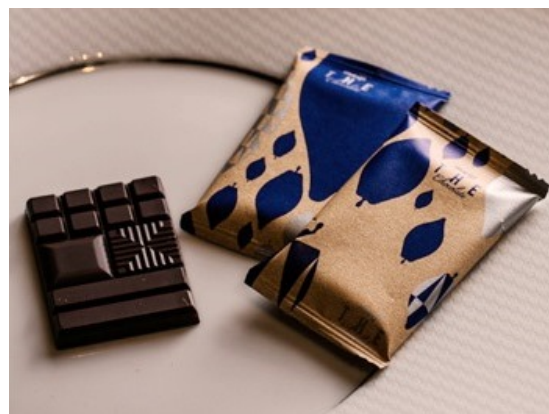
ナッツのような奥深い旨味をもつチョコレートと共にお楽しみください。(提供は1杯につき1個となります)

※上記料金は消費税(8%)を含んでおります。ロイヤルパークホテル ザ 汐留 「THE BAR」のご料金は、サービス料(10%)を含んでおります。