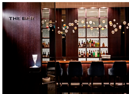
お一人でも気軽にお立ち寄りいただけます。(画像はロイヤルパークホテル ザ 京都)