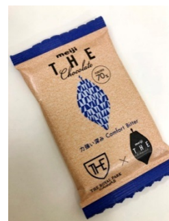
2つの「THE」のロゴが描かれたホテル限定パッケージ。

中でも、デジタルネイティブであるミレニアル世代を迎える「CANVAS」では、自動精算機の導入などサービスの自動化を進め、スムーズなサービスの提供を行うと同時に、スタッフとの心地よいつながりを感じていただくことを心がけております。その最初のきっかけとして、ご到着時にスタッフより、「ザ ロイヤルパーク キャンバスオリジナルデザイン明治ザ・チョコレート コンフォートビター(16.7g)」を手渡しします。国内外からのお客様に、明治こだわりのチョコレートで、おもてなしの気持ちを共に伝えてまいります。