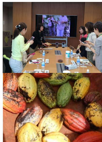
(上)レッスンでは、カカオの産地や品種などの知識も得ることができます。 (下)日本でめったに見ることのない本物のカカオポッド(カカオの実)をご用意します。

カカオレッスンの後は、セミナーのために各ホテルで考案したスペシャルメニューをご用意いたします。チョコレートが織りなす魅惑の味とともに、特別な午後をお過ごしください。